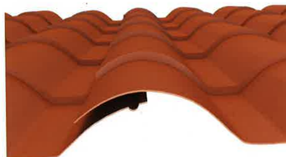
Sovrapposizione di mezza onda Overlapping of half a corrugation